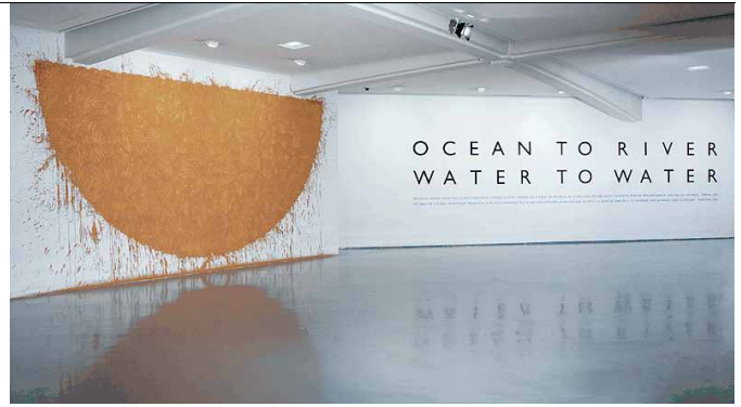
Autre travail in situ de Richard Long avec de la boue au Mamac de Nice, 31 mai-16 novembre 2008.

Quelle que soit l'utilisation qu'il en fait, ce qu'il apprécie, c'est l'infinité des variations qu'offre la boue, les effets qu'elle produit, ses couleurs. Quoi de plus intéressant pour un artiste que de travailler avec un matériau éphémère et évanescent. Car il est antinomique à l'art même, qui lui tend à s'inscrire dans la durée, qui a la volonté de demeurer.