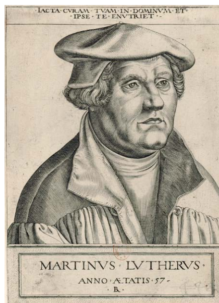
René Boyvin, Portrait de Martin Luther , 1546, BnF, Estampes et photographie, RÉSERVE FOL-QB-201 (3)

Théologien français, Jean Calvin (1509-1564) est, avec Martin Luther (1483-1546), l'un des principaux artisans de la Réforme protestante. Tenant de la « double prédestination » (Dieu, dans sa toute-puissance, détermine le salut ou la perdition des hommes), Calvin revendique la primauté de la Bible, son accessibilité au plus grand nombre et sa popularisation. L'essor de l'imprimerie à partir du xv e siècle, qui accélère et amplifie la diffusion des savoirs, favorise la propagation du protestantisme à travers l'Europe.