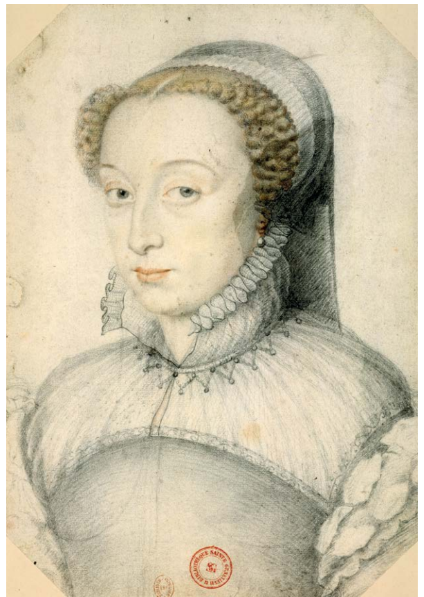
François Clouet, Catherine de Médicis jeune , 1540, BnF, Estampes et photographie, RÉSERVE NA-22 (4)-BOÎTE

« Je n'aime point ces noms qui sont finis en os, Gots, Cagots, Austrogots, Visgots et Huguenots, Ils me sont odieux comme peste, et je pense Qu'ils sont prodigieux à l'empire de France ».