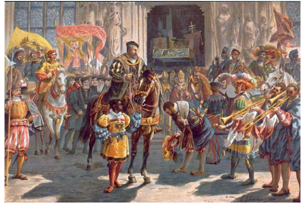
L'empereur Charles Quint à Strasbourg (19 septembre 1552), 1894, BnU de Strasbourg, NIM33623

En français, le terme de protestant s'est d'abord appliqué aux luthériens d'Allemagne et de Suisse puis aux Français (1546), restant toutefois rare jusqu'au xvii e siècle, au profit des termes huguenot ou réformé .