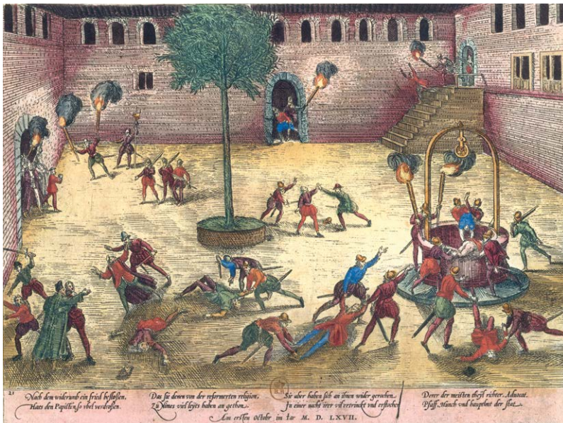
Frans Hogenberg, Michelade protestante de Nîmes , 1567, BnF, Estampes et Photographie, QE-64-PET FOL