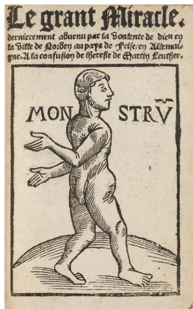
« Le grant miracle dernièrement adueni par la voultente de Dieu en la ville de Norden au pays de Frise, en Allemagne. A la confusion de l'heresie de Martin Leuther » Le Grant Miracle, Paris, vers 1530, BnF, Rés. 8o NFG. 82.

Pour leur part, Luther et son confrère humaniste Philippe Melancthon (1497-1560) avaient publié en 1523 un livret où l'on relatait la naissance d'un veau et d'un âne en forme de moine et de pape, allégories de l'Église romaine. Comme on le voit, les deux camps, recourent aux mêmes armes rhétoriques.