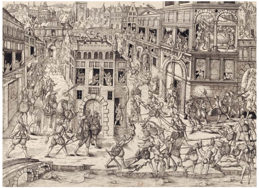
Massacre de la Saint-Barthélemy, BnF, 1572, Estampes et photographie, RÉSERVE FOL-QB-201 (7)

1787 Par l'édit de tolérance, Louis XVI accorde l'état civil aux réformés. La religion protestante est tolérée de fait dans le royaume.