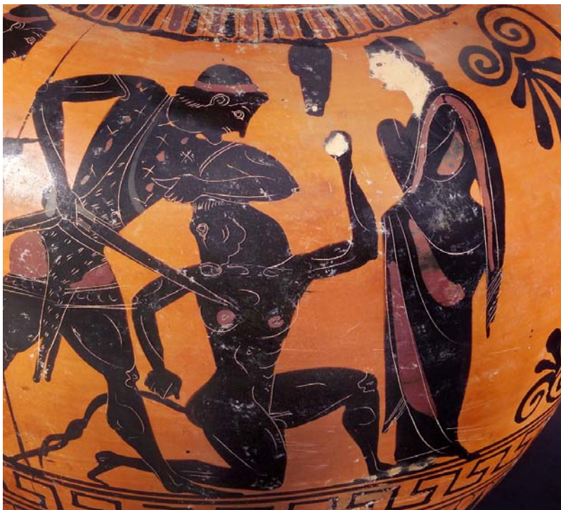
Amphore de Thésée et le Minotaure, attribuée au groupe de Londres, céramique attique à figures noires, Athènes, vers 540 av. J.-C., BNF, Monnaies, médailles et antiques, De Ridder 227

Monstre d'argile façonné par les dieux pour affronter Gilgamesh et faire en sorte qu'il modère ses exigences face à ses sujets, il vit au départ dans la forêt. Ce monstre est progressivement humanisé et éduqué à la vie d'homme par une courtisane, qui le mène dans la cité de Gilgamesh. Tous deux se battent mais sont égaux dans la lutte : Gilgamesh interrompt le combat et offre son amitié à Enkidu. Ensemble, ils quittent la vie sédentaire et décident d'accomplir de grandes choses, en commençant par s'attaquer au monstre du pays des Cédres. Ils mènent une lutte acharnée, avec l'aide de Shanash, le Soleil, qui déclenche un ouragan : le monstre est jeté à terre et décapité par les deux compagnons, malgré la réticence de Gilgamesh. Acclamés lors de leur retour à Uruk, les deux compagnons tuent le taureau géant envoyé par Ishtar, la déesse de l'Amour, dont Gilgamesh a refusé les avances. Les dieux