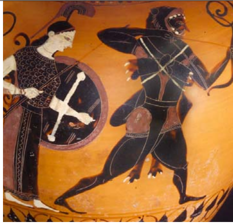
Amphore d'Héraclès et de Géryon, attribuée au Swing Painter, céramique attique à figures noires, Athènes, vers 540 av. J.-C., BNF, Monnaies, médailles et antiques, De Ridder 223

La lutte d'Héraclès contre Géryon, thème central du dixième des travaux du héros, est illustrée sur plusieurs vases attiques à figures noires. Géryon, roi de Tartessos, vivait retiré