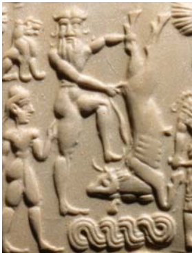
Sceau-cylindre « Gilgamesh domptant un taureau », Syrie, xvii e siècle av. J.-C., hématite, BNF, Monnaies, médailles et antiques, Delaporte 435

- Le retour au pays des vivants : arrivé sur le rivage, Gilgamesh aperçoit une source et y boit, épuisé par la longue traversée. Il pose l'herbe magique au bord de l'eau et un serpent, alléché par l'odeur de l'herbe, la dérobe. Le héros revient donc dans sa cité d'Uruk sans avoir pu rapporter son butin.